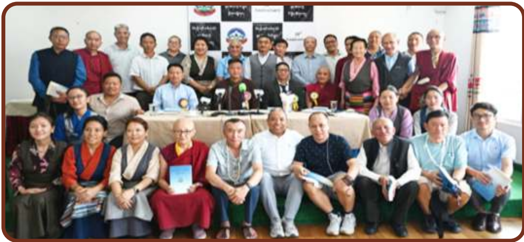
བོད་ལྷན་འབྲེལ་གྱི་གསོ་བ་རིག་པའི་ལྷན་ཚོགས་ཀྱི་ལོ་རྒྱུས་ཕྱོགས་བསྐྱེགས་དཔེ་དེབ་དབུ་འབྲེལ་དང་ལྷན་ཚོགས་ཀྱི་ལོ་རྒྱུས་ལྷན་ཚོགས་འདུར་ཆེད་ཕེབས་སྐུ་མཁོན་དང་དེབ་སྐྱེལ་སྐྱོང་བ་རྣམས་ལ།