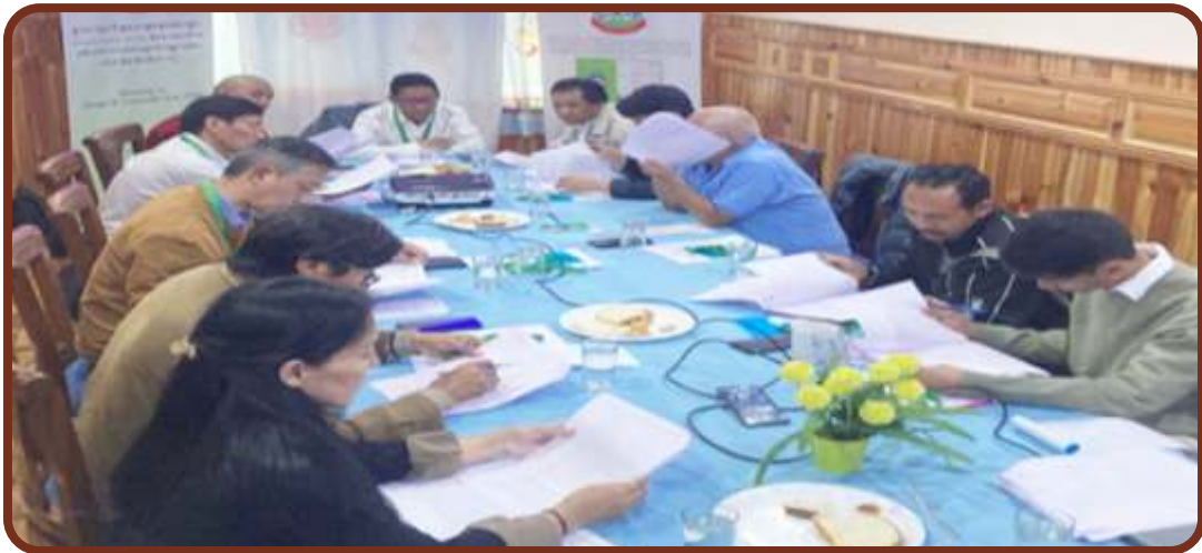
ཕྱི་ལོ་ ༢༠༡༩ ལྷན་ ༤ ཆེས་ ༥ ཉིན་རྒྱ་གར་གཞུང་གི་སྐྱོང་དང་སྐྱོང་ཚུལ་ཐོན་བསྐྱེད་ཁྲིམས་འཆར་ཐོག་ལྷན་ཚོགས་འདུ་ཚོགས་བཞེས་པའི་རྣམས་ལ།