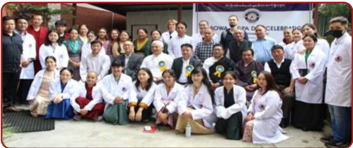
སྤྱི་ལོ་ ༢༠༢༣ ཟླ། ༩ ཚེས་ ༡༡ ཉིན་རྒྱལ་ཡོངས་བོད་ཀྱི་གསོ་བ་རིག་པའི་ཉིན་མོ་ ཐེངས་ལྔ་པ་སྐབས་བཅུ་ལྔ་པ་ལ།