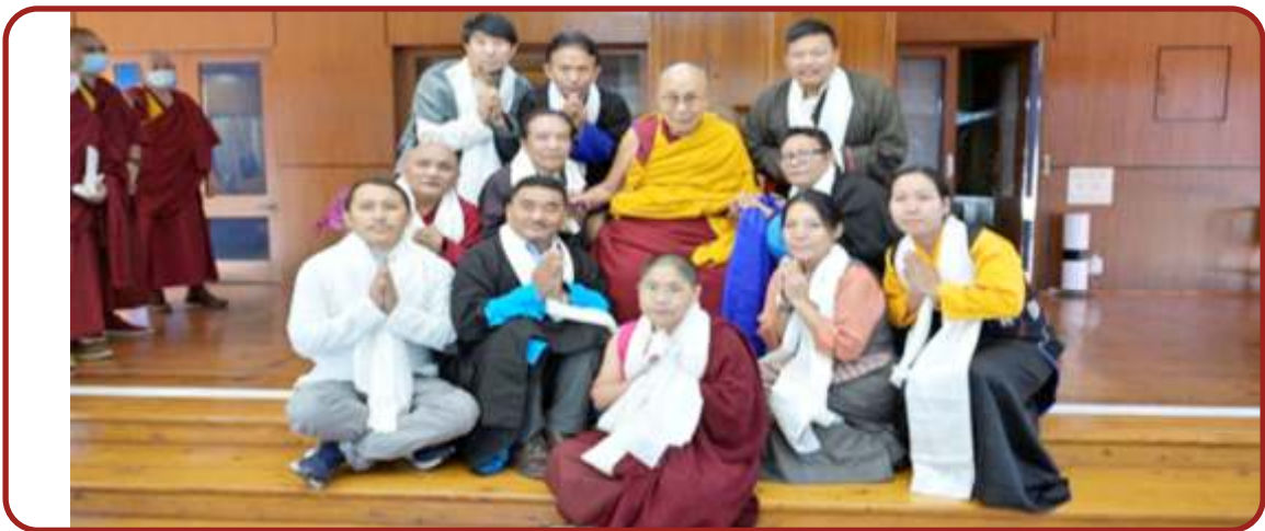
བོད་ཀྱི་གསོ་བ་རིག་པའི་ལྷན་ཚོགས་ཀྱི་སྐབས་བསྐྱོད་པའི་ཚོགས་མི་རྣམས་ལ་ཤེས་རྒྱ་ལོ་རྒྱུ་ལོ་རྒྱུ་ལ་ ཤེས་བྱ་མགོན་ཆེན་པོ་མཚོ་གཉིས་ཀྱི་མཇུག་ལའི་སྐབས་བཟང་ཐོབ་པ།