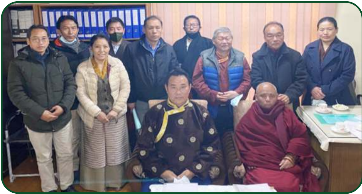
བོད་ཀྱི་གསོ་བ་རིག་པའི་ལྷན་ཚོགས་དབུ་བརྟེན་ནས་ལོ་ ༡༢ ལོ་རྒྱུ་བའི་དུས་ཚོགས་སྤང་བ་ཚེ། ༡༩༩༩་ལོ་༡༡་ལོ་༡༤