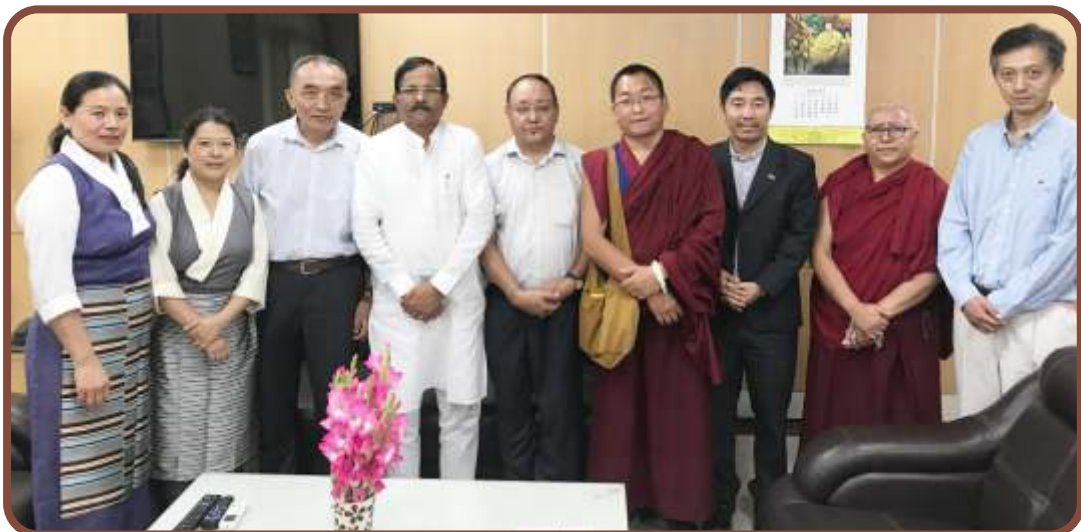
གསོ་བ་རིག་པའི་སྐྱེ་ཆབ་ལྷན་ཆེན་གསལ་གྱི་ལྷན་ཆེན་གསལ་གནང་བ། ༢༠༡༩༥༡༡༦