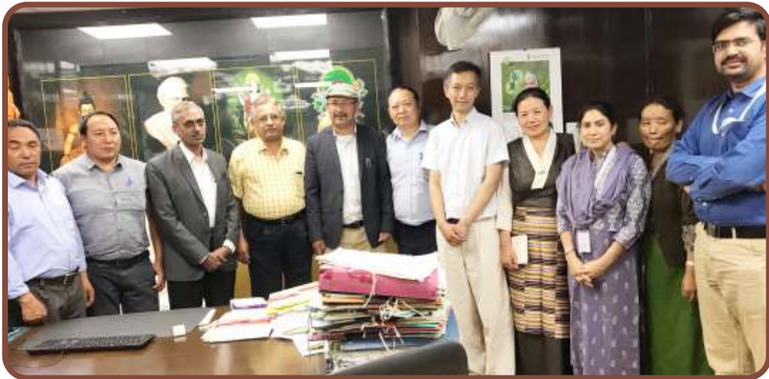
ཁྱེད་ཀྱི་ལྷན་ཆེན་གསལ་གྱི་གསོ་བ་རིག་པའི་ལྷན་ཆེན་ཐེངས་དང་པོ་བསྐྱོང་ཆེན་གསལ་གནང་བ། ༢༠༡༩༥༡༡༦