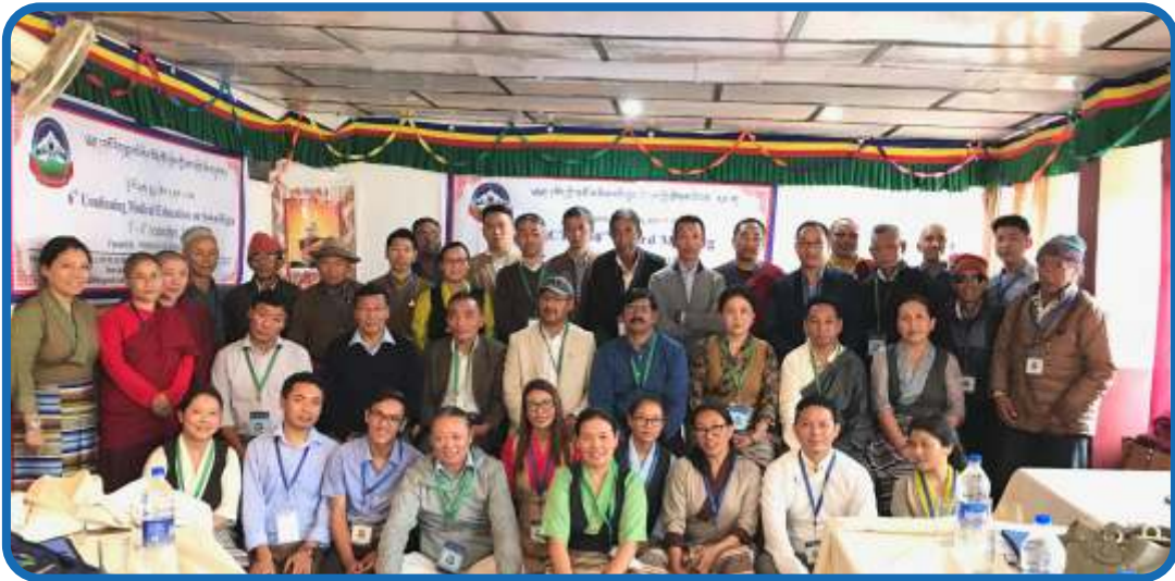
གསོ་རིག་སྒྲན་པའི་ཤེས་ཡོན་གོང་སྤེལ་ཟབ་འབྲིང་ཐེངས་དྲུག་གསལ། རྫ་རམ་སྤྱ་ལྷ། ༢༠༡༤།༩།༣་་་ བཅ།