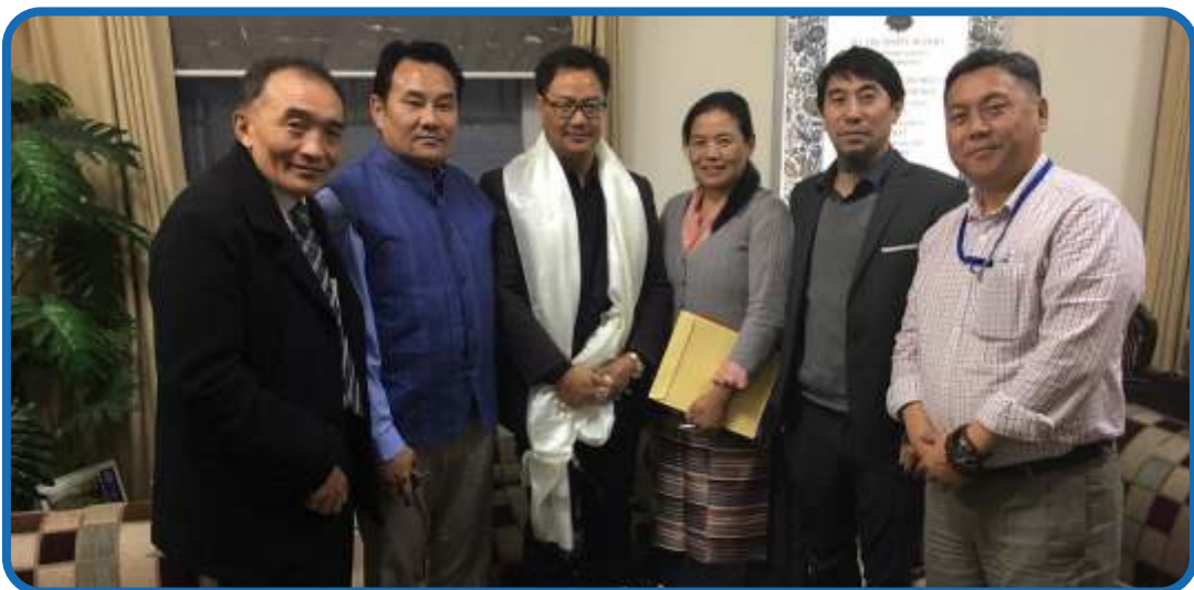
རྒྱ་གར་དབྱུས་གཞུང་གི་ནང་སྤྱི་མྱེ་ཁྱབ་སྒྲོན་ཆེན་གཞོན་པ་སྤྱི་ཞབས་ཀི་རན་རི་རུ་རི་དང་མཇལ་སྤང་ཁྱུས་གསལ།